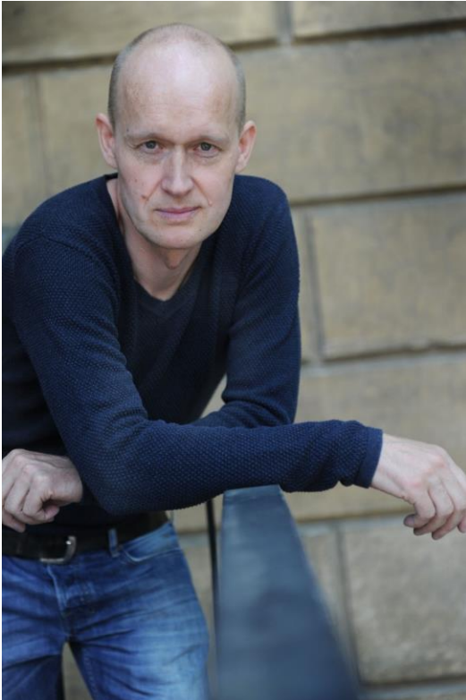
Arno Geiger