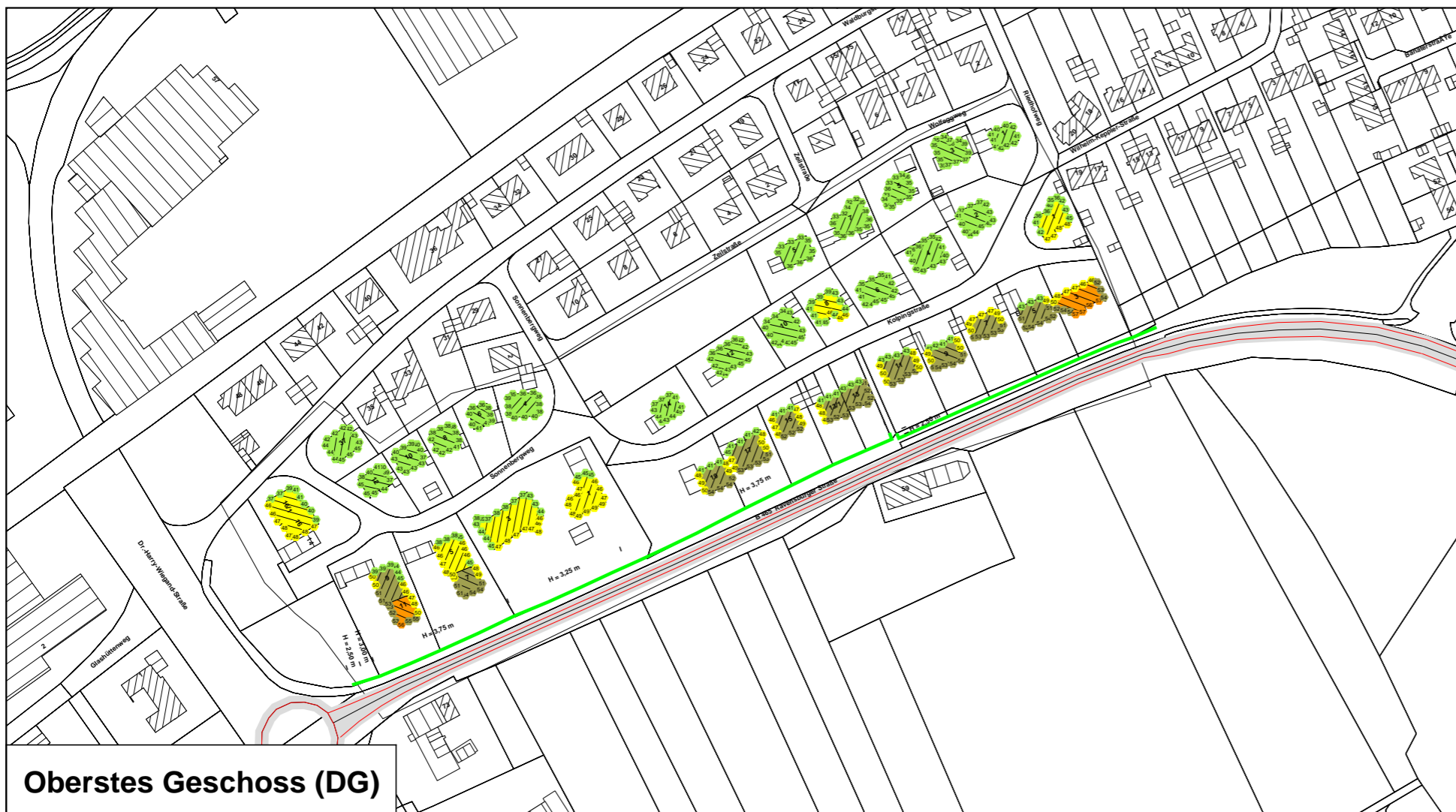
Oberstes Geschoss (DG)